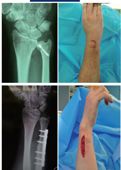
(上) 3cmの小さな皮切で行う骨幹部での尺骨短縮術 (下) 6〜8cmの皮切の骨幹部での尺骨短縮術

手関節の月状骨が壊死を起こすキンベック病の治療でも実績を上げています。橈骨短縮術が一般的だが、手術の傷が約10cmと大きく、長い金属プレートをを用いるため、治療後にもう一度手術を施す必要がある。同院では有頭骨部分短縮骨切術を開発し、手術に臨んでいる。この手術法では、手背に3cmの皮切を加えるだけで済み、しかもスクリーナー本しか使わないため抜釘術が必要ない。