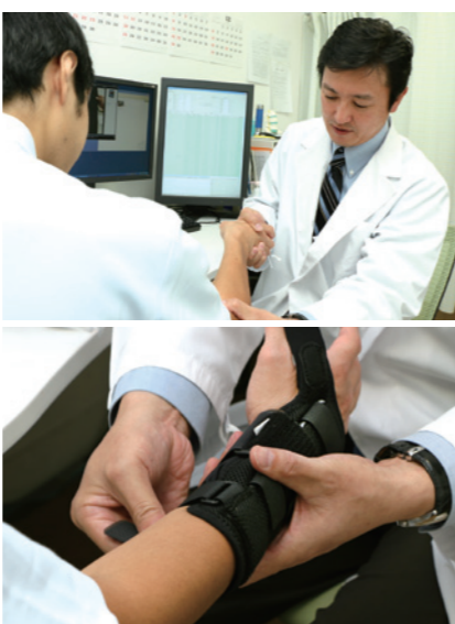
「正確な解剖学的・運動学的研究に基づいた高度な診断が求められるTFCC損傷。手首の甲のところに金属の棒が入ったオリジナル器具は、一般販売もついでに

手術では、内視鏡による修復術や尺骨短縮術などで対応している。ただ、例えば、骨幹部の尺骨短縮術の場合、6〜8cmの皮切で金属プレート